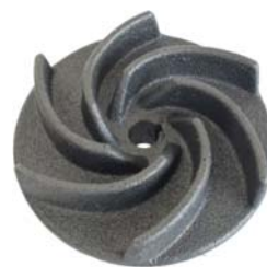
Vortex NC / ND

Sur demande les tensions et les fréquences peuvent être différentes.