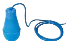
IFB Régulateur de niveau