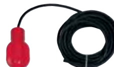
MICROSTART Interrupteur de niveau