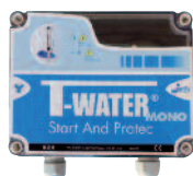
Coffret Mono SP