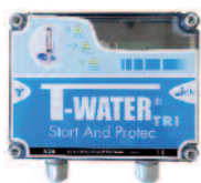
Coffret Tri SP